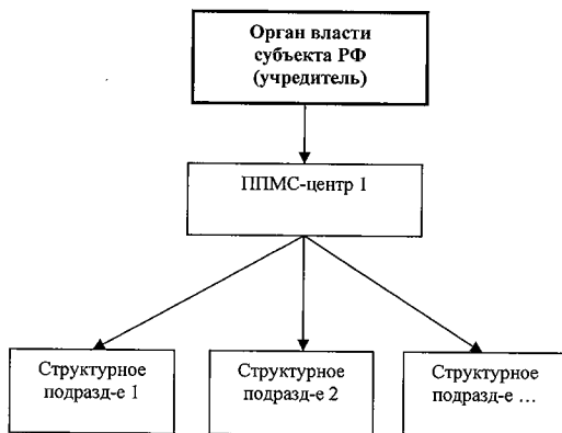
Рис.2. Схема централизованной модели организации деятельности ППМС-центров

В регионе уполномоченным органом власти создается Центр с филиалами, которые распределяются в соответствии со спецификой территориального расположения, численностью детского населения и его потребностью в помощи. Центр представляет собой жесткую иерархическую систему оказания психолого-педагогической, медицинской и социальной помощи. Такая структура позволяет обеспечить высокую централизацию управления, единый стандарт услуг, рациональное использование кадровых и финансовых ресурсов, прозрачность и достоверность результатов деятельности.